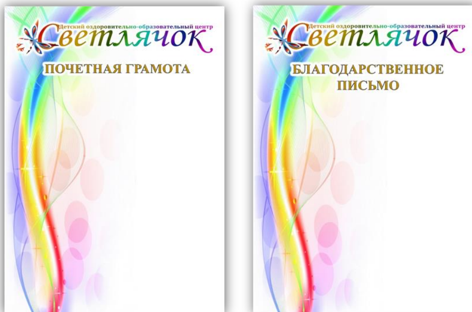
Рисунок 3 – Фирменные бланки учреждения