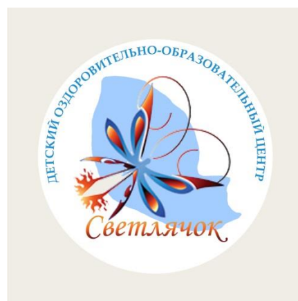
Рисунок 2 – Логотип учреждения