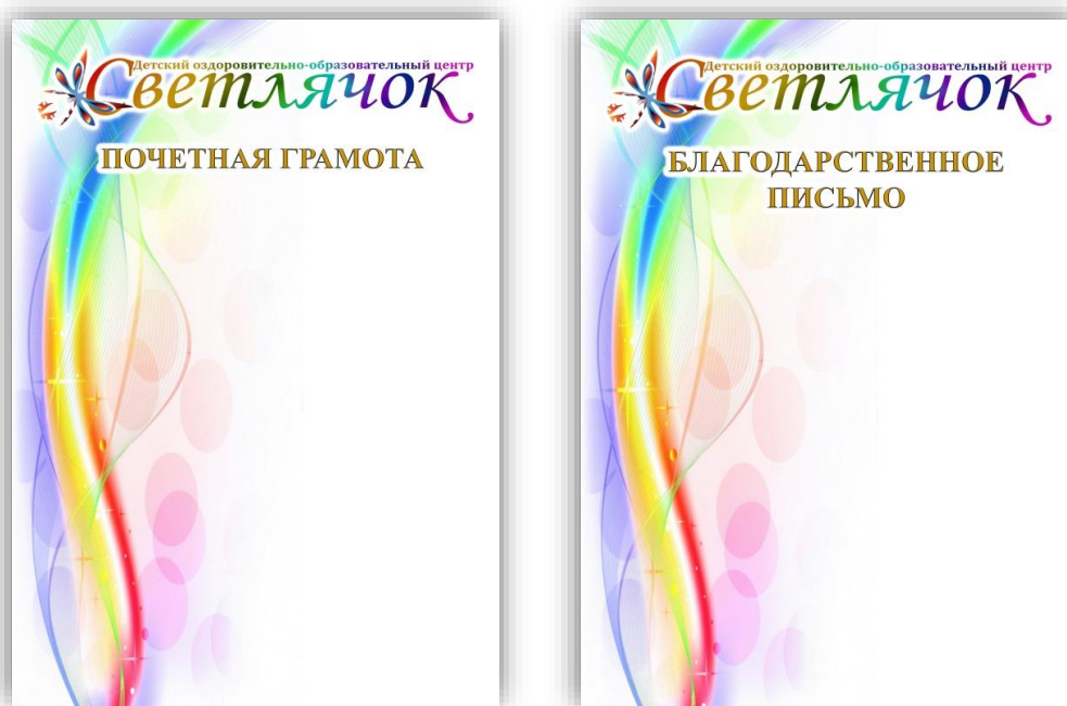
Рисунок 3 – Фирменные бланки учреждения